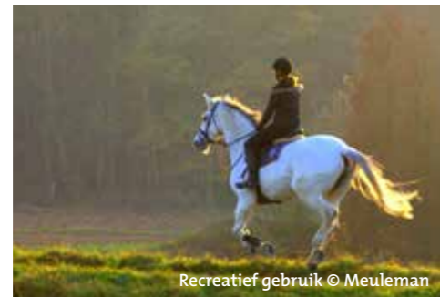
Recreatief gebruik

zijn dan ook duidelijk merkbaar. Er is een enorme toename van versnipperde percelen en het opduiken van schuilhokken, rijpistes, ruitersporen, maneges, jumpingconstructies, lichtbakken en afrasteringen. Het veranderd landgebruik en het beheer van graasweiden heeft bovendien een niet te onderschatten impact op het landschap, de biodiversiteit, de waterhuishouding en de groenstructuren van onze provincie. Het is dan ook cruciaal deze landschappelijke transformatie op een verantwoorde manier in te passen binnen onze steeds schaarser wordende open ruimte.