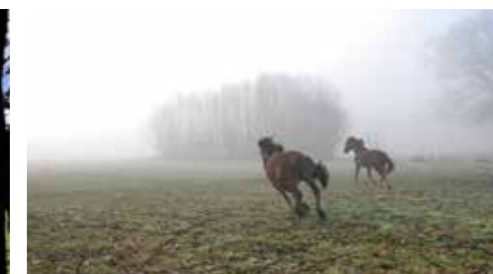
Ruimte om te bewegen