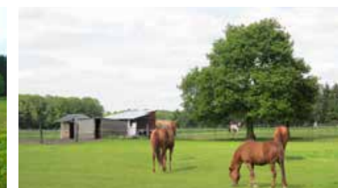
Schaduwboom in paardenweide