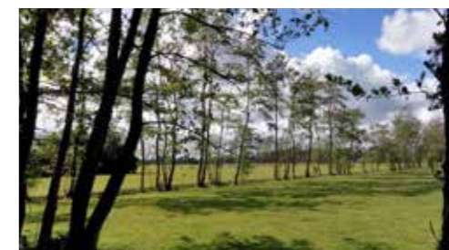
Dunne elzensingel rond weide