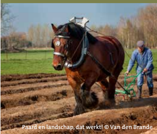
Paard en landschap, dat werkt!

De toename van het aantal paardenhouders biedt heel wat kansen voor biodiversiteit, ecologisch herstel en vrijwaring van waardevolle landschappen. Door streekeigen kleine landschapselementen te integreren, paardenweides als kruidenrijke graslanden te beheren en landschapsvriendelijke materialen te gebruiken, bent u naast paardenhouder, ook landschapsbouwer!