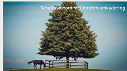
Schaduwboom met houten omkadering

-Door schaduwbomen, knotbomen, houtkanten en heggen te integreren zorg je voor beschutting tegen zon, regen en wind, geef je structuur aan het landschap en bezorg je andere faunasoorten voedsel- en schuilmogelijkheden.