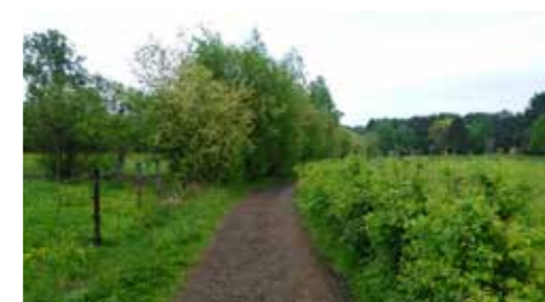
Meidoornhaag rond weide