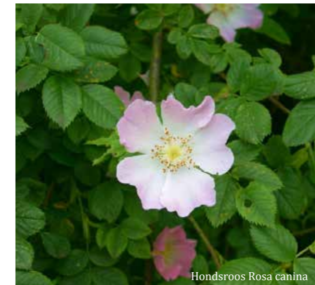
Hondsroos Rosa canina