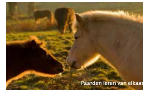
Paarden leren van elkaar

Paarden zijn kuddedieren die nood hebben aan gezelschap, beweging, voedsel en water . De weide is dé plaats bij uitstek waar paarden zich "thuis" voelen. Het is de natuurlijke biotoop van het gedomesticeerde paard. Paarden geven zelfs de voorkeur aan de relatieve vrijheid op de weide boven, het op het eerste zicht, hogere comfort in een stal of schuilhok.