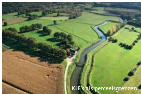
KLE's als perceelsgrenzen

Overal in Vlaanderen vind je verschillende streken. Bij elke streek hoort een landschapstype. Zo zijn er boscomplexen, valleigebieden, open-, halfopen- en gesloten landschappen. Elk van deze landschapstypes is opgebouwd uit specifieke kleine landschapselementen (KLE's) zoals autochtone bomen, houtkanten, heggen, poelen, weiden en graslanden. Vroeger werden deze elementen gebruikt als perceelscheidingen, bron van gerief- of brandhout, oriëntatiepunten, veekering, extra schaduw en watervoorziening, maar ook vandaag bewijzen zij hun nut.