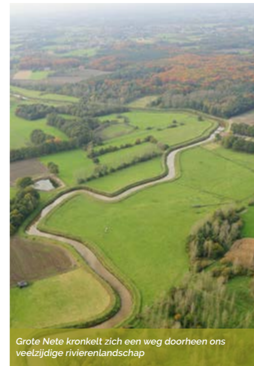
Grote Nete kronkelt zich een weg doorheen ons veelzijdige rivierenlandschap

Jij woont in Rivierenland. Dat is de waterrijke regio in het zuidwesten van de provincie Antwerpen! Vanuit de lucht gezien, onderscheidt de wirwar van waterlopen onze regio met de rest van Vlaanderen. De getijdenrivieren Dijle, Nete, Rupel, Schelde en Zenne vormen de blauwe draad. Met eb en vloed bepaalden zij eeuwenlang het ritme van onze regio en verbonden letterlijk levens, gebruiken en materialen. En daar mogen we best trots op zijn! #ikbenrivierenlander