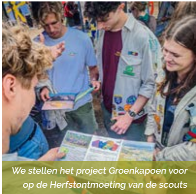
We stellen het project Groenkapoen voor op de Herfstontmoeting van de scouts