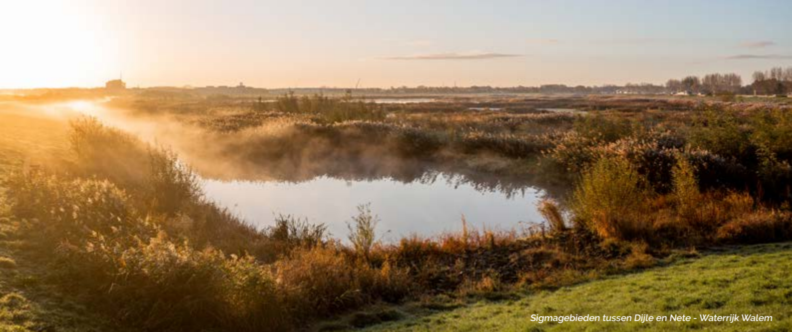
Sigmagebieden tussen Dijle en Nete - Waterrijk Walem