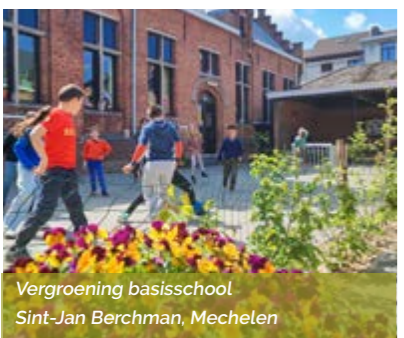
Vergroening basisschool Sint-Jan Berchman, Mechelen

Scholen kunnen zich kandidaat stellen via: www.rtrl.be/projecten/groene-oases