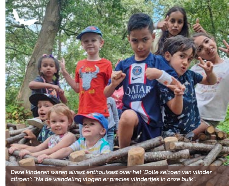
Deze kinderen waren alvast enthousiast over het 'Dolle seizoen van vlinder citroen': "Na de wandeling vlogen er precies vlindertjes in onze buik".