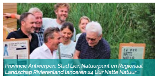
Provincie Antwerpen, Stad Lier, Natuurpunt en Regionaal Landschap Rivierenland lanceren 24 Uur Natte Natuur