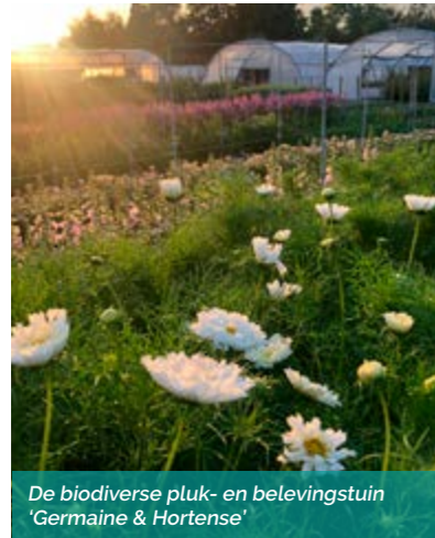
De biodiverse pluk- en belevingsstuin 'Germaine & Hortense'

Hoe zorgen we ervoor dat de landbouwsector in de toekomst voldoende water heeft? Een belangrijk vraagstuk waar we met Life ACLIMA, het wateronderzoeksproject van de Europese Unie, een antwoord op willen geven.