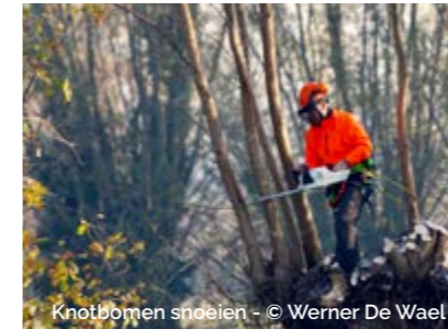
Knotbomen snoeien

MEER INFO & MAANDKALENDER: www.regionalelandschappen.be/regionalelandschappen