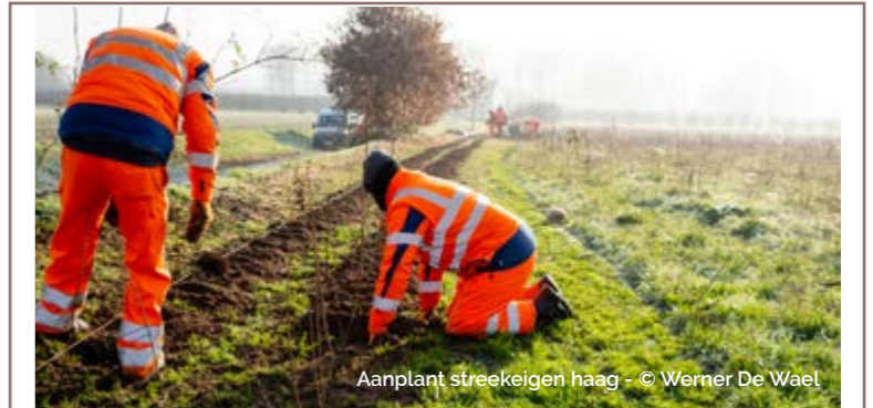
Aanplant streekeigen haag

MEER INFO: www.rtrl.be/agenda/cursus-haagvlechten