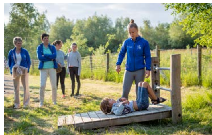
MOLENBEEKSE Plassen Sportievelingen leven zich uit op de outdoor fitness-toestellen in de Molenbeekse plassen in Rumst.