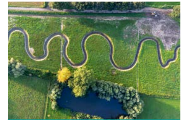
Hermeandering Babbelse beek - Duffel