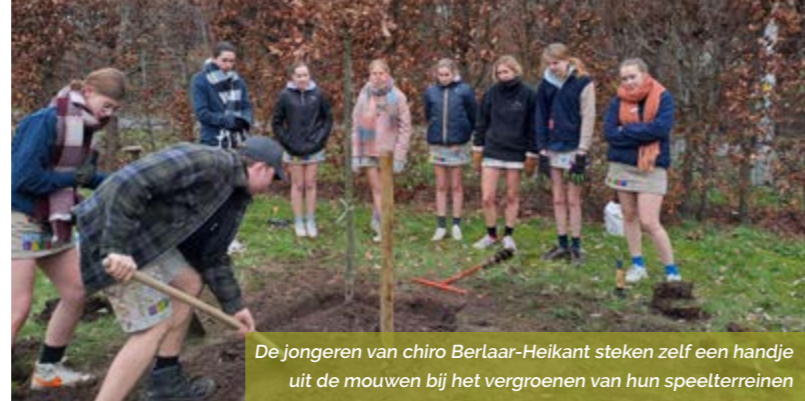
De jongeren van chiro Berlaar-Heikant steken zelf een handje uit de mouwen bij het vergroenen van hun speelterreinen