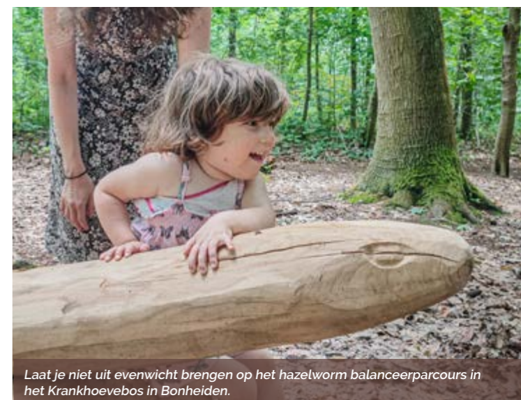
Laat je niet uit evenwicht brengen op het hazelworm balanceercours in het Krankhoevebos in Bonheiden.

Je kan alle kindervandelingen gratis downloaden via: www.rirl.be/samen-op-pad Volg de Facebookpagina voor extra nieuwtjes: www.facebook.com/vandaagsamenoppad