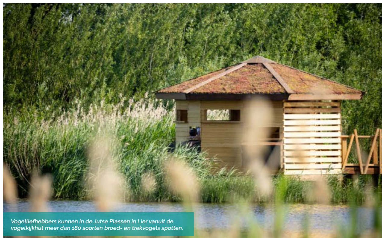
Vogelliefhebbers kunnen in de Jutse Plassen in Lier vanuit de vogelkijkhut meer dan 180 soorten broed- en trekvogels spotten.

De provinciale overstromingsgebieden geven ruimte aan water en houden zo onze voeten en huizen droog. Met het project Buurtstroom hebben we ervoor gezorgd dat je deze natte natuur ook echt kan beleven.