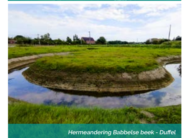
Hermeandering Babbelse beek - Duffel