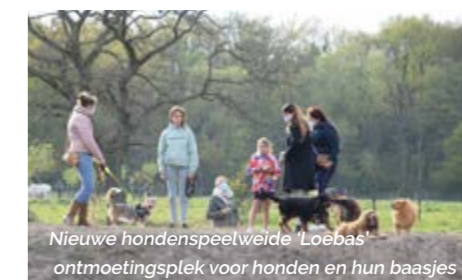
Nieuwe hondenspeelweide 'Loebas' ontmoetingsplek voor honden en hun baasjes