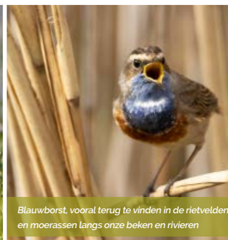
Blauwborst, vooral terug te vinden in de rietvelden en moerassen langs onze beken en rivieren