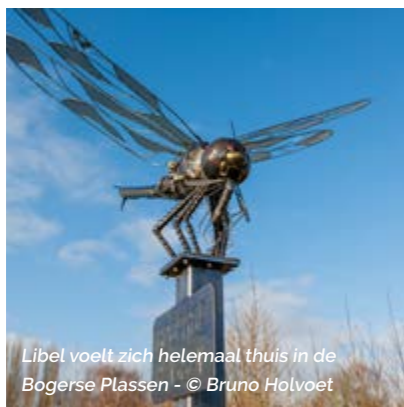
Libel voelt zich helemaal thuis in de Bogerse Plassen