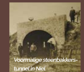
Voormalige steenbakkerstunnel in Niel