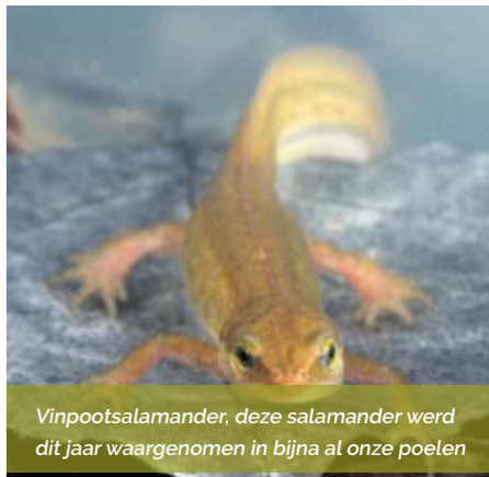
Vinpoetsalamander, deze salamander werd dit jaar waargenomen in bijna al onze poelen