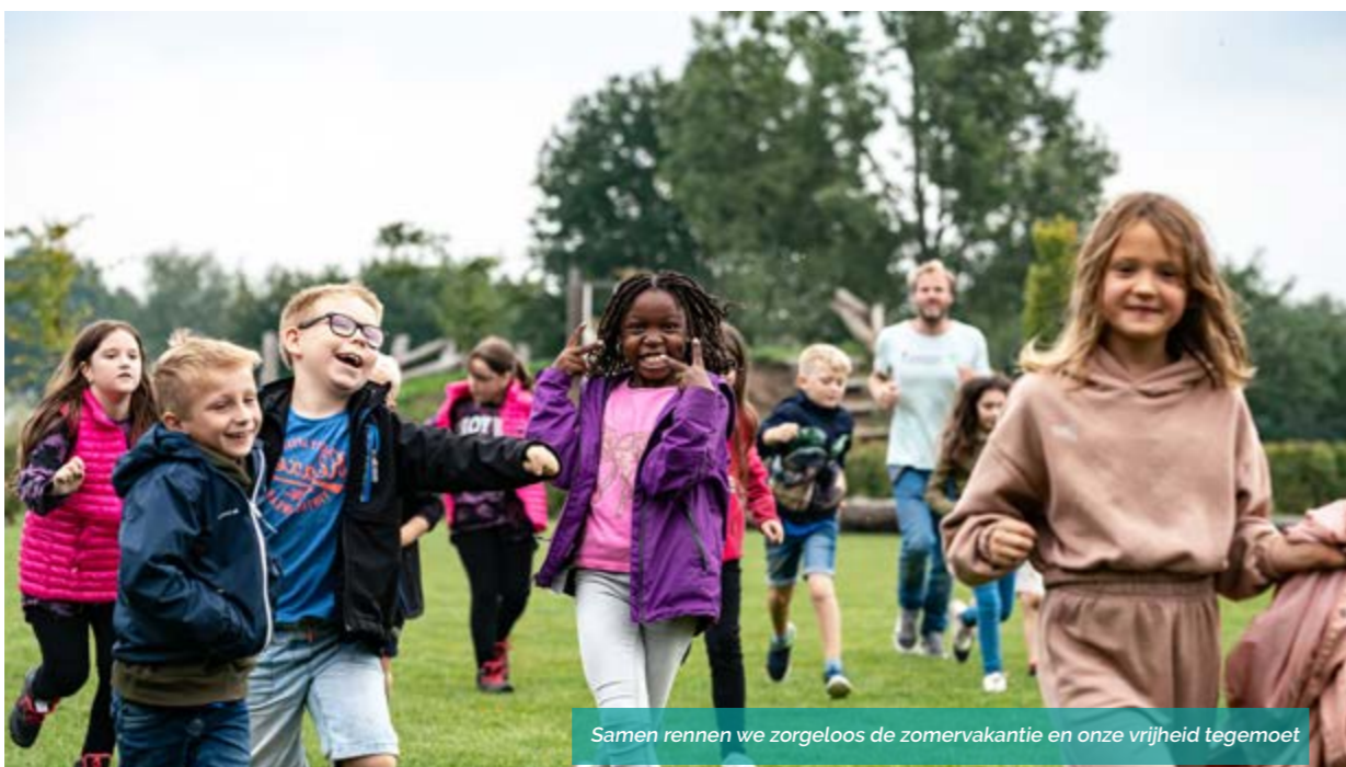
Samen rennen we zorgeloos de zomervakantie en onze vrijheid tegemoet

TIP: JE VINDT ALLE PROJECTEN OP ONZE NIEUWE WEBSITE: WWW.RLRL.BE