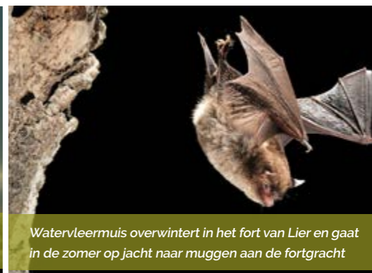
Watervleermuis overwintert in het fort van Lier en gaat in de zomer op jacht naar muggen aan de fortgracht