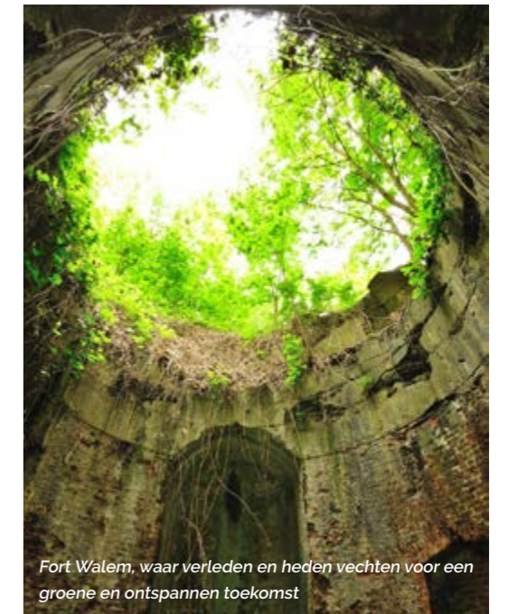
Fort Walem, waar verleden en heden vechten voor een groene en ontspannen toekomst

MEER INFO: WWW.RLR.BE/PROJECTEN/HEROVER-DE-VESTINGSTEDEN