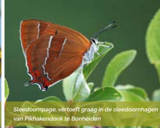
Sleedoornpage, vertoeft graag in de sleedoornhagen van Pikhakendonk te Bonheiden