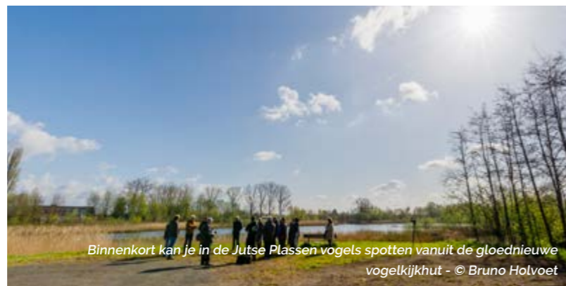
Binnenkort kan je in de Jutse Plassen vogels spotten vanuit de gloednieuwe vogelkijkhut