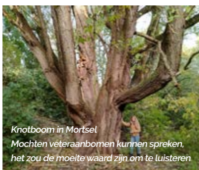
Knotboom in Mortsel Mochten veteranenbomen kunnen spreken, het zou de moeite waard zijn om te luisteren

Neem dan contact op met iris.verstuyft@rlrl.be , 015 28 05 94