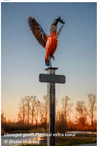
Ijsvogel geeft Plaslaar extra kleur