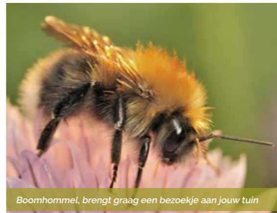
Boomhommel, brengt graag een bezoekje aan jouw tuin