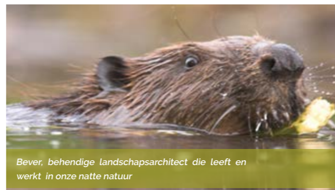
Bever, behendige landschapsarchitect die leeft en werkt in onze natte natuur