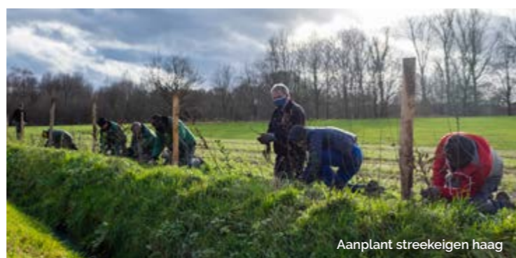
Aanplant streekeigen haag

Heb jij knotbomen die gesnoeid moeten worden? Registreer je aanvraag via WWW.GOEDGEKNOT.BE . Lees wel eerst goed de knotvoorwaarden.