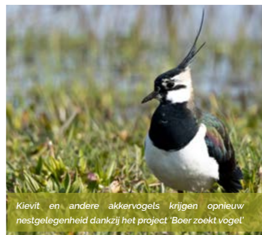
Kievit en andere akkervogels krijgen opnieuw nestgelegenheid dankzij het project 'Boer zoekt vogel'