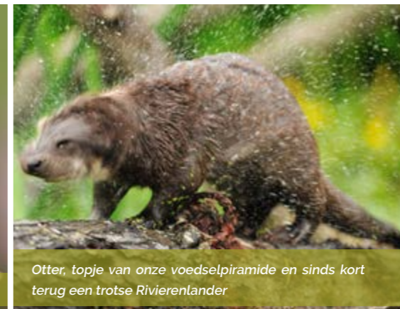
Otter, topje van onze voedselpiramide en sinds kort terug een trotse Rivierenlander