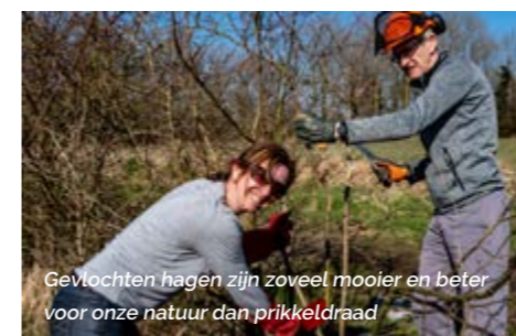
Gevlochten hagen zijn zoveel mooier en beter voor onze natuur dan prikkeldraad

WORKSHOP HAAGVLECHTEN WANNEER: 8/2/23, Sint-Katelijne-Waver INSCHRIJVEN: Charlotte.dewit@rlrl.be WWW.RLRL.BE/AGENDA