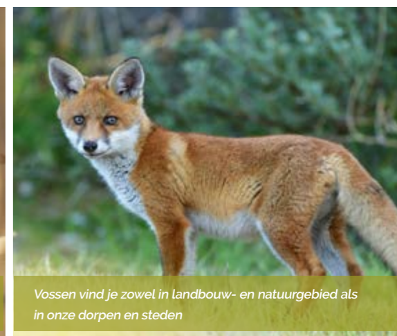
Vossen vind je zowel in landbouw- en natuurgebied als in onze dorpen en steden