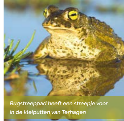
Rugstreeppad heeft een streepje voor in de kleiputten van Terhagen

Bijna 10% van de ruimte in Vlaanderen bestaat uit tuinen. Ze hebben een enorm potentieel in de strijd tegen de klimaatverandering en achteruitgang van de biodiversiteit. Jouw tuin, klein of groot, kan een verschil maken voor natuur en klimaat! Daarom organiseren we samen met Regionaal Landschap De Voorkempen een groepsaankoop inheemse hoogstam- en fruitbomen. Wij zorgen voor kwalitatief, streekeigen plantgoed aan een goede prijs.