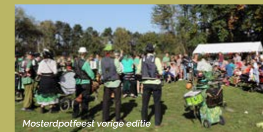
Mosterdpotfeest vorige editie

Op 2 oktober kan je het Curieuzeneuze-mosterdpad ontdekken tijdens het Mosterdpotfeest: Een pittig natuurevenement met bosspelen, een touwenparcours, een paddenstoelenwandeling en live muziek dat plezier en verwondering belooft voor jong en oud. Tussendoor kan je ergezellig kuieren langs diverse kraampjes op de belevenissenmarkt, terwijl je lokale lekkernijen proeft. WWW.RLRL.BE/AGENDA/MOSTERDPOTFEEST