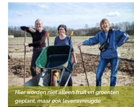
Hier worden niet alleen fruit en groenten geplant, maar ook levensvreugde

ONTDEK ALLE SPEELZONES VIA: WWW.NATUURENBOS.BE/SPELEN SPEELBOSSEN RIVIERENLAND: WWW.RLRL.BE/BELEVEN