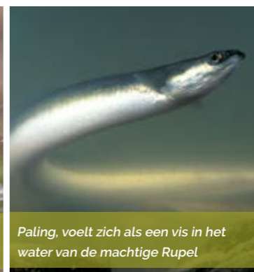
Paling, voelt zich als een vis in het water van de machtige Rupel