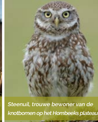
Steenuil, trouwe bewoner van de knotbomen op het Hombeeks plateau