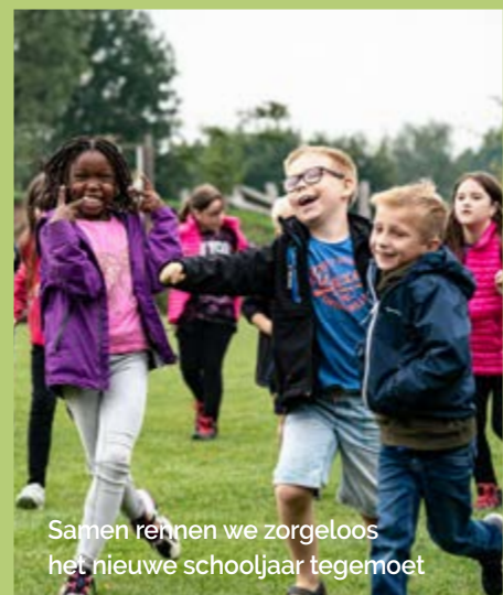
Samen rennen we zorgeloos het nieuwe schooljaar tegemoet

ONDERSTEUNING NODIG OF ADVIES OVER DE JUISTE AANPAK? NEEM CONTACT OP MET INFO@RLRL.BE MEER INSPIRATIE VIND JE VIA WWW.RLRL.BE/PROJECTEN