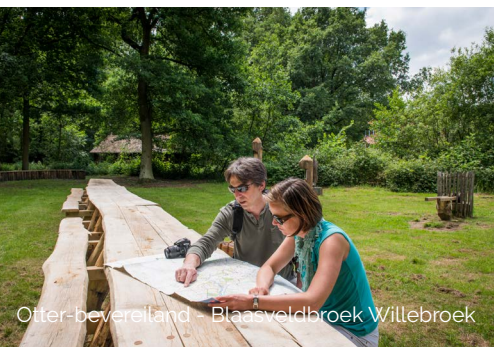
Otter-beveriland - Blaasveldbroek Willebroek

Het Battenbroek ligt aan de monding van Nete en Dijle en vormt als erfgoedlandschap een geheel met het Zennegat. Talrijke kleine landschapselementen, kasteelparken en oude dijken dragen bij tot het schilderachtige karakter.