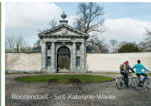
Roosendael - Sint-Katelijne-Waver