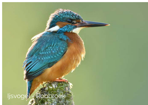
Ijsvogel - Robbroek