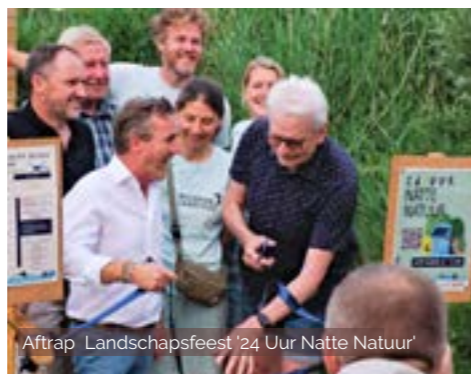
Aftrap 'Landschapsfeest '24 Uur Natte Natuur'

Rivierenland telt 875 km bewegwijzerde wandelpaden . In 2023 actualiseerden we Wandelgebied Rivierenland met o.a. 7 nieuwe wandellussen. Verder voegden we 4 nieuwe wandelingen toe aan ons kindervandellussenaanbod 'Samen op Pad' en herwerkten we de themawandellussen: 'Klinkaartroute', 'Otters en bevers op het spoor' en 'Vallei van de Zenne'. We werkten ook aan de uitvoering van de trage wegen in Boechout, Bonheiden, Heist-op-den-Berg, Berlaar, Nijlen, Borsbeek, Mechelen, Willebroek en Lier. Tot slot lanceerden we met 'Veleau overstromingsroute' een nieuwe fietsbrochure .