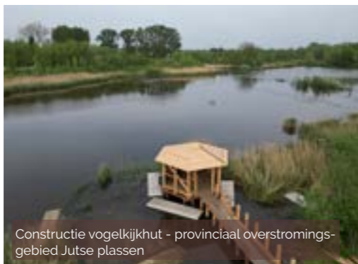
Constructie vogelkijkhut - provinciaal overstromingsgebied Jutse plassen

Wij zetten onze schouders mee onder de 'Blue Deal' van de Vlaamse overheid om het landschap te wapenen tegen waterschaarste en wateroverlast . Zo werken we aan waterduurzaamheid voor landbouw en creëren we samen met onze partners de komende jaren ook heel wat hectaren robuuste en beleefbare valleinatuur in 5 beekvalleien . Bovendien werven we een projectmedewerker Blue Deal aan om onze watergerelateerde projecten te coördineren. Met het project 'Buurtstroom' werkten we het belevingspotentieel uit van 5 provinciale overstromingsgebieden met o.a. een educatieve steiger, een vogelkijkhut en een groene outdoor gym.