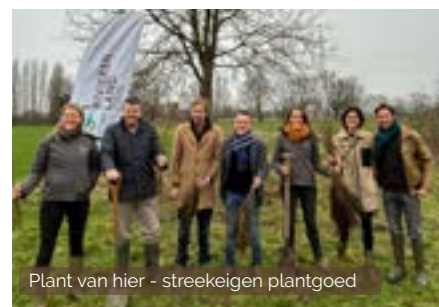
Plant van hier - streekeigen plantgoed

We beheerden vorig jaar meer dan 200 monumentale bomen . Onze knotvrijwilligers knotten 320 knotbomen. Daarnaast inventariseerden we samen met IOED Berg & Nete, IOED Zuidrand en IOED Rupelstreek meer dan 1000 bomen met erfgoedwaarde.