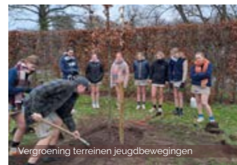
Vergroening terreinen jeugdbewegingen