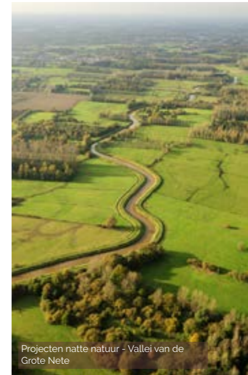
Projecten natte natuur - Vallei van de Grote Nete

Tot slot integreren wij relevante maatschappelijke thema's zoals: klimaat, waterhuishouding, eco-systeemdiensten, groen in de stad, ontharding, erfgoed en welzijn in onze projecten.