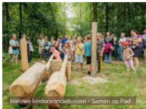
Nieuwe kindervandellussen - Samen op Pad