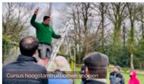
Cursus hoogstamfruitbomen snoeien