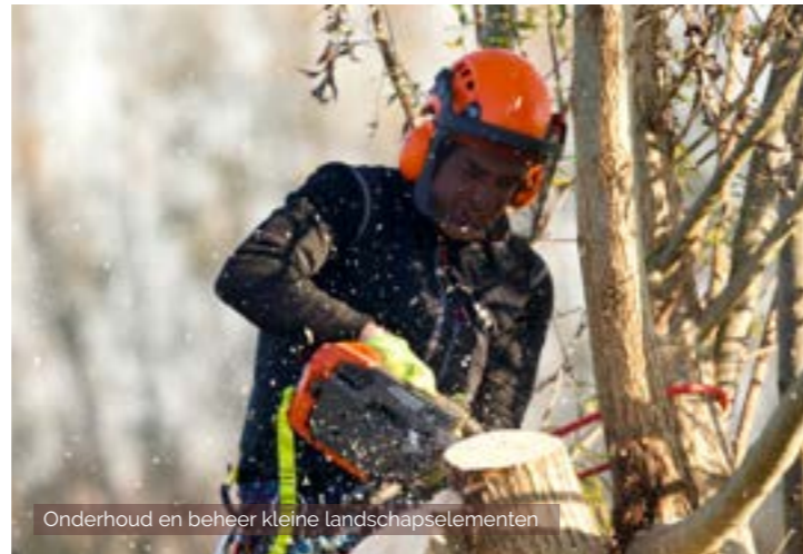
Onderhoud en beheer kleine landschapselementen

Regionaal Landschap Rivierenland wordt financieel gesteund door de Vlaamse Overheid, Provincie Antwerpen en de gemeenten: Berlaar, Bonheiden, Boom, Duffel, Heist-op-den-Berg, Hemiksem, Lier, Mechelen, Niel, Nijlen, Putte, Rumst, Schelle, Sint-Katelijne-Waver, Willebroek, Aartselaar, Boechout, Borsbeek, Edegem, Hove, Kontich, Lint & Mortsel.