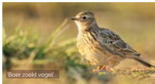
'Boer zoekt vogel'