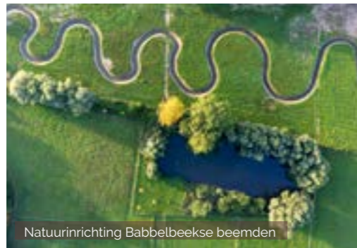
Natuurinrichting Babbelbeekse beemden

In 2023 zorgden we voor de aanplant van 32200 stuks streekeigen plantgoed , goed voor 4,5 km hagen en heggen, 4300 m 2 houtkanten en 166 dreefbomen. Daarnaast legden we 16 hoogstamboomgaarden aan met 264 lokale fruitbomen, plantten we 148 solitaire bomen en 107 knotbomen.