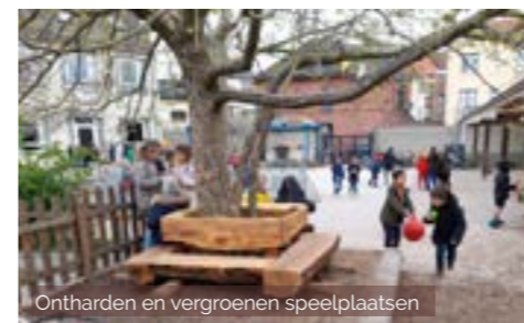
Ontharden en vergroenen speelplaatsen