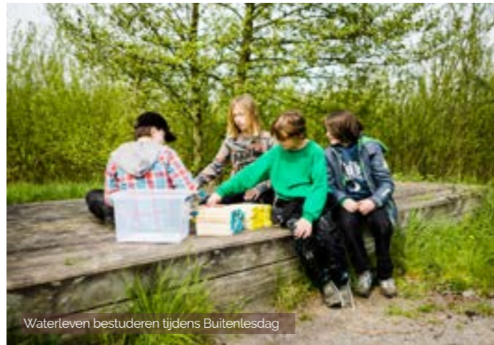
Waterleven bestuderen tijdens Buitenlesdag