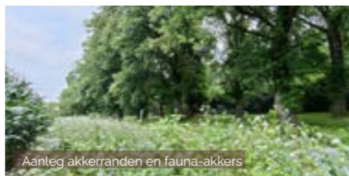
Aantleg akkerranden en fauna-akkers

In 2023 zaaiden we meer dan 58 ha biodiversiteitsmengsels in bij 40 landbouwers. Met het project 'Boer zoekt vogel' namen we bovendien specifieke landschappelijke maatregelen i.f.v. akkervogels zoals patrijs, geelgors, Kievit en zomertortel in de vallei van de Grote Nete. Met het Loket Onderhoud Buitengebied organiseren en ondersteunen we het regulier beheer van landschapselementen in het buitengebied van verschillende gemeenten. We brachten o.a. 2200 waardevolle bomen in kaart voor toekomstig beheer.