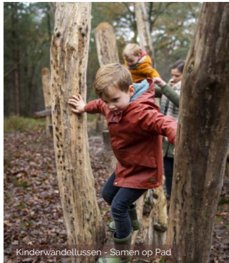
Kinderwandellussen - Samen op Pad

In 2022 zaaiden we meer dan 40 ha biodiversiteitsmengsels in bij 24 landbouwers. Met het project 'Boer zoekt vogel' namen we bovendien specifieke landschappelijke maatregelen i.f.v. akkervogels zoals patrijs, geelgors, Kievit en zomertortel in de vallei van de Grote Nete.