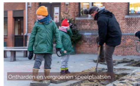
Ontharden en vergroenen speelplaatsen