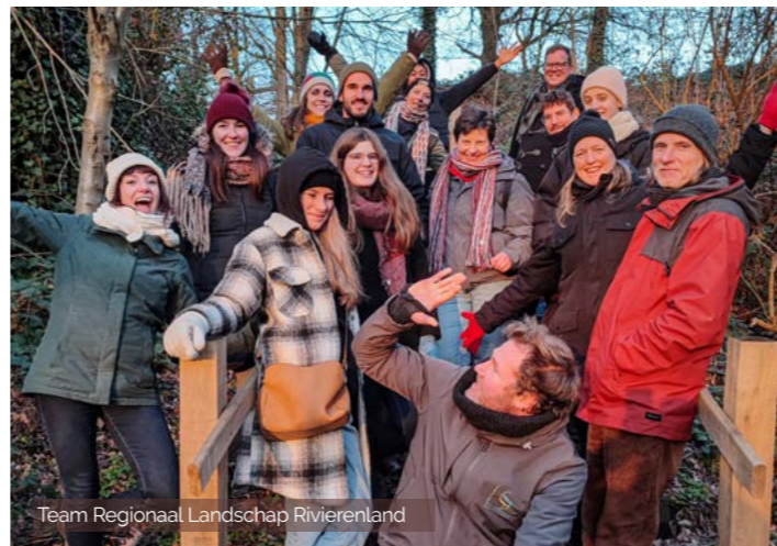
Team Regionaal Landschap Rivierenland