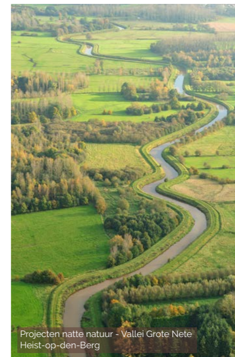
Projecten natte natuur - Vallei Grote Nete Heist-op-den-Berg

Tot slot integreren wij relevante maatschappelijke thema's zoals: klimaat, waterhuishouding, eco-systeemdiensten, groen in de stad, ontharding, erfgoed en welzijn in onze projecten.