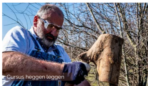
Cursus heggen leggen

In 2022 organiseerden we de Dag van de regionale landschappen. We inspireerden de medewerkers van de Vlaamse regionale landschappen met de veelzijdigheid, de troeven en de uitdagingen van onze rivierenregio aan de hand van heel wat boeiende landschapsactiviteiten en 8 excursies.