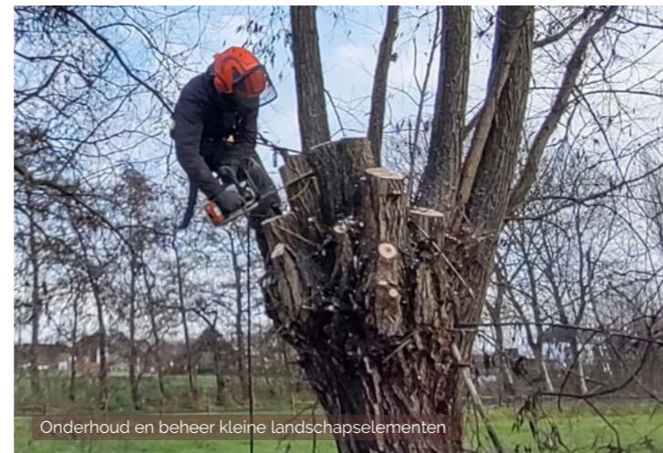
Onderhoud en beheer kleine landschapselementen