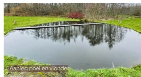
Aanleg poel en vlinder

Heel wat terreinrealisaties maken deel uit van gebiedsgerichte projecten. Voor het Strategisch Project 'ORION' creëren we een dynamisch belevingslandschap tussen de stad Mechelen en Dijle-Zennevallei. Daarnaast maken we deel uit van de stuurgroep 'Natuurpark Rivierenland'. Als partner in het erfgoedproject 'Herover de vestingsteden' zochten we mee naar een herbestemming van militair erfgoed in Lier en Mechelen. Verder voeren we de gebiedsprogramma's: 'Zuidrand' en 'Rupelstreek' mee uit. Tot slot ondersteunen we in Lier en Nijlen de klimaatprogramma's van het Strategisch Project 'Méér veerkracht in de Vallei van de Kleine Nete'. Ook in de vallei van de Grote Nete werken we, in samenwerking met Provincie Antwerpen, sinds vorig jaar aan een klimaatrobust landschap waar heel wat te beleven valt.